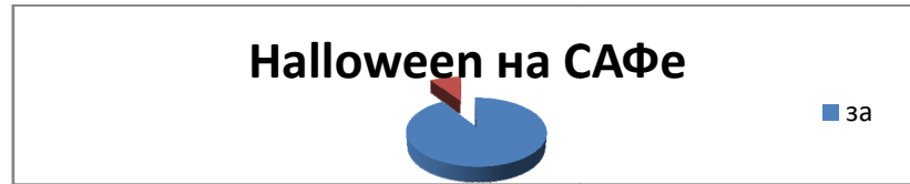
Рис. 1. Распределение голосов опрошенных в поддержку праздника

С целью изучения мнения студентов САФ о желании и готовности принять участие в празднике мы провели опрос. Он позволил выяснить, что абсолютное большинство опрошенных студентов «за» проведение данного мероприятия на САФе (см. рис.1). Всего было опрошено 74 человека, в их число входили как студенты, так и преподаватели. В ходе анкетирования были выявлены студенты, желающие принять активное участие в нашем проекте.