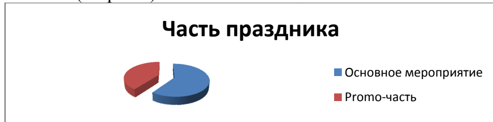
Рис.3. Распределение голосов по вопросу «какая часть проекта понравилась больше»

Кроме того, мы выяснили, что хотя и реклама, и основное мероприятие вызвали у студентов бурю эмоций, основное мероприятие понравилось опрошенным больше (см.рис 3).