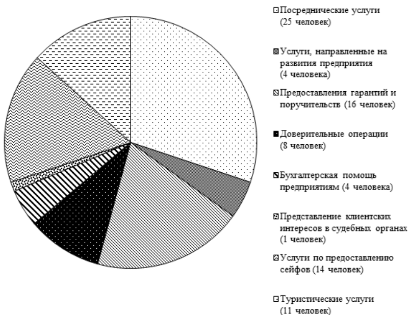
Рис. 2. Нетрадиционные банковские услуги в банках города Иркутска

Теперь рассмотрим наиболее востребованные среди жителей города Иркутска нетрадиционные банковские операции (рис. 2).